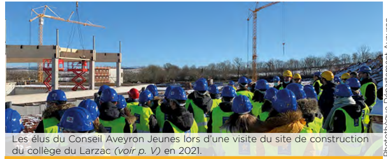
Les élus du Conseil Aveyron Jeunes lors d'une visite du site de construction du collège du Larzac (voir p. V) en 2021.

Vote. Les élèves de 5 e ainsi que les délégués des classes de 6 e , 4 e et 3 e peuvent voter pour élire ce conseil.